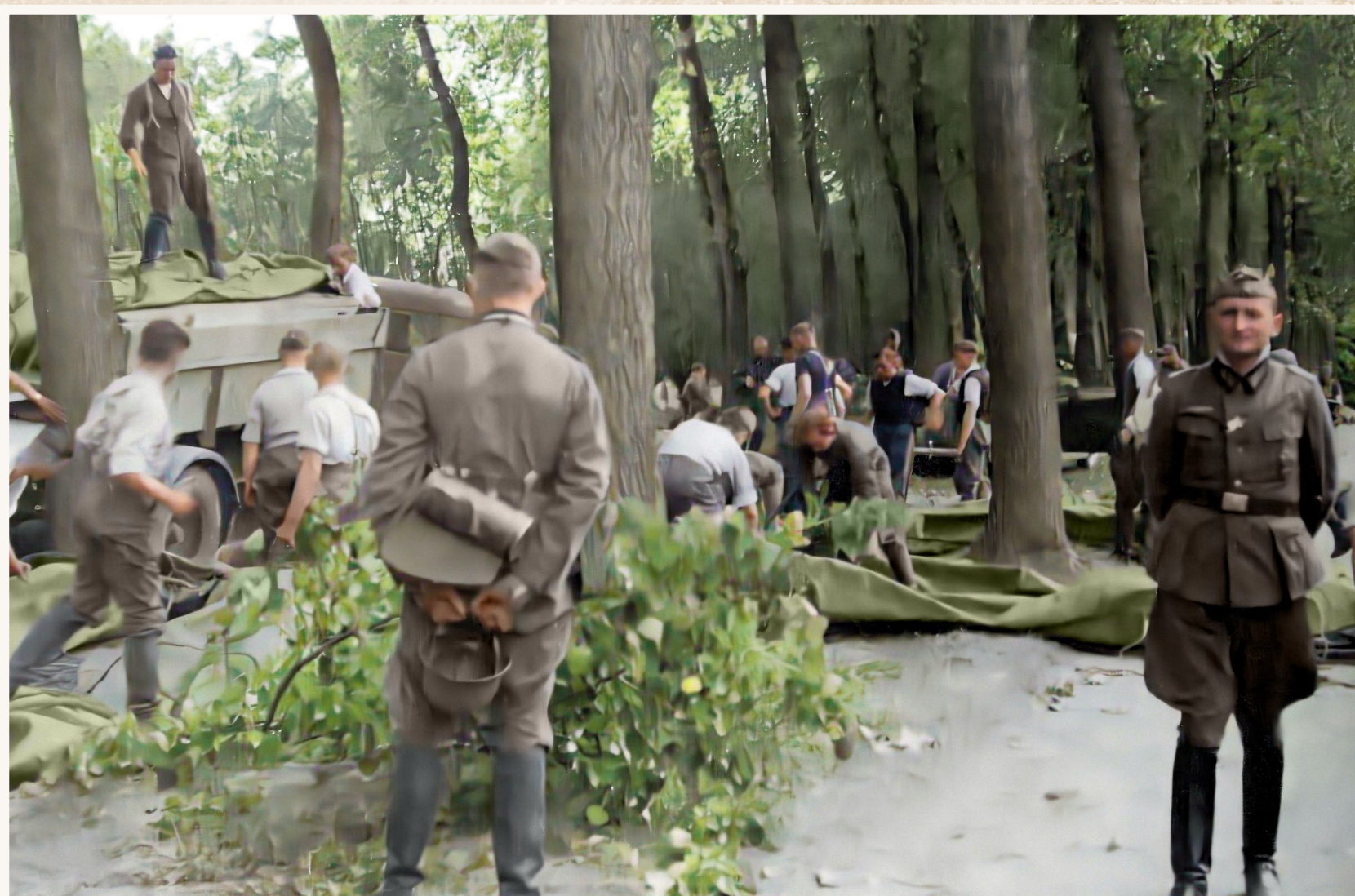
Duitse troepen zijn opgerukt tot aan het Schipdonkkanaal en maken zich klaar om over te steken ter hoogte van Meigem. Aan de overkant verdedigen twee Belgische regimenten het kanaal.