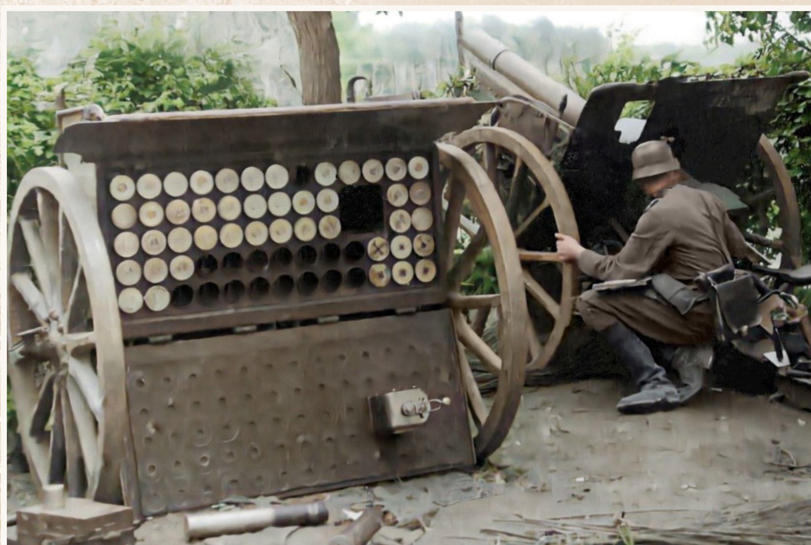
De Duitsers kunnen vrij vlug oprukken richting Vinkt. Zo kan een stoottroep al rond 9 u. op Kruiswege, op de grens van Meigem met Vinkt, een groep van de Belgische artillerie uitschakelen.