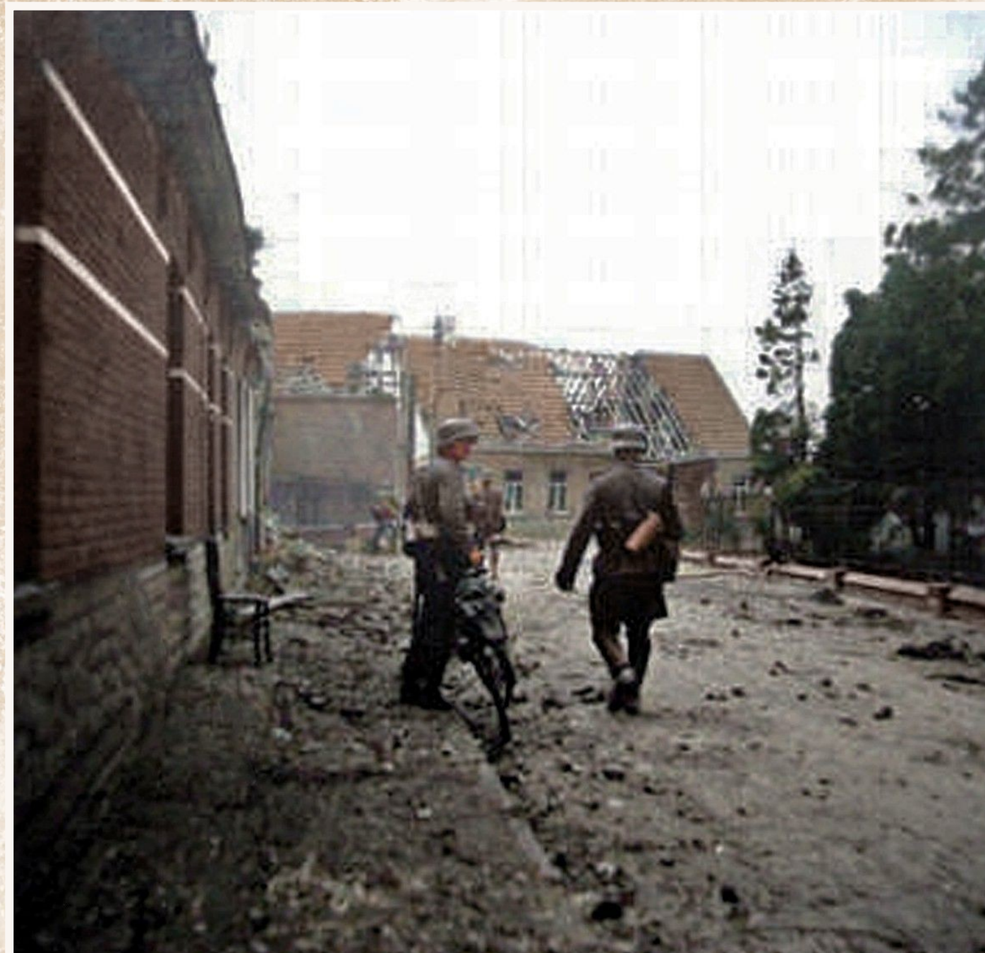
Tegelijk begint de Belgische artillerie de bres in Meigem te beschieten waardoor huizen vernield worden en 20 dodelijke slachtoffers vallen onder de burgerbevolking.