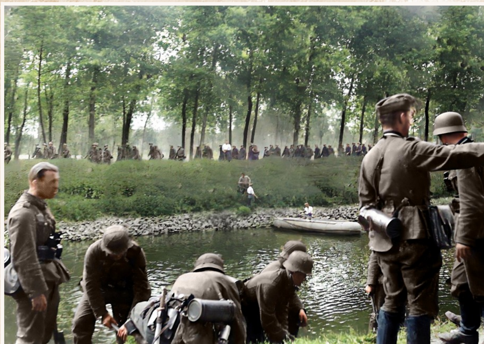
Meteen wordt een grote bres geslagen in de Belgische linies.