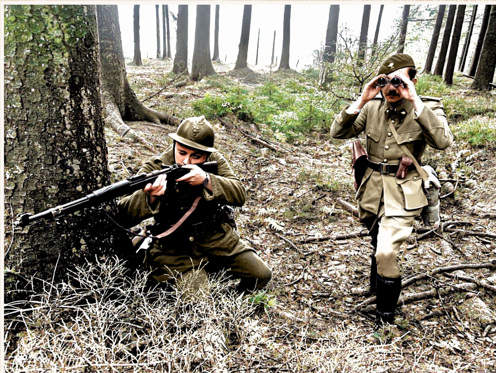
Om de bres te dichtten, beslist de Belgische legerleiding om twee bataljons van het 1ste Regiment Ardense Jagers op te stellen oostelijk van Vinkt (foto re-enactment).