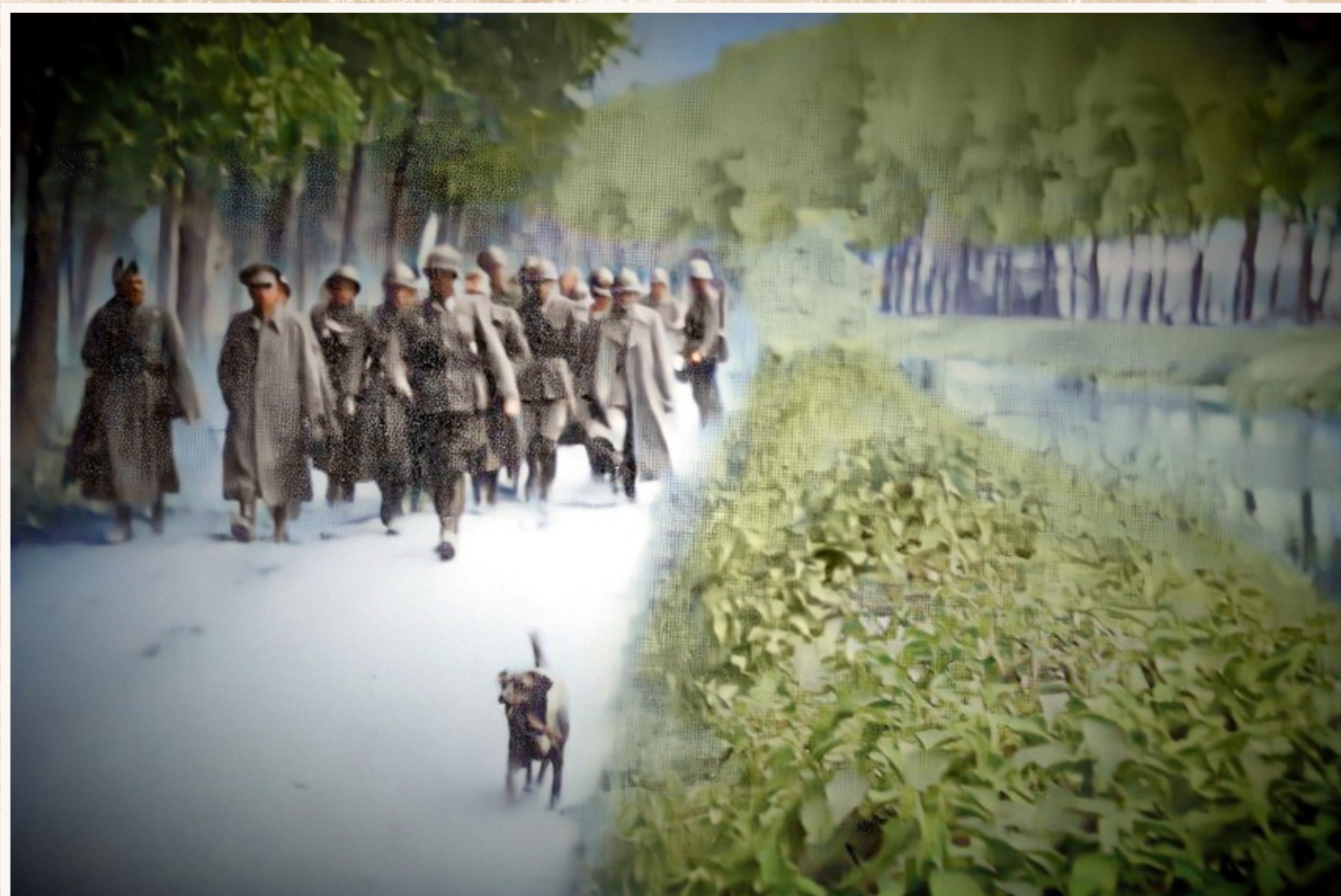
Door het vele terugtrekken maar ook om politieke redenen, zijn de meeste Belgische soldaten aan het kanaal weinig gemotiveerd om weerstand te bieden aan de Duitsers. Nagenoeg 5.000 man geeft zich zonder veel verweer over.