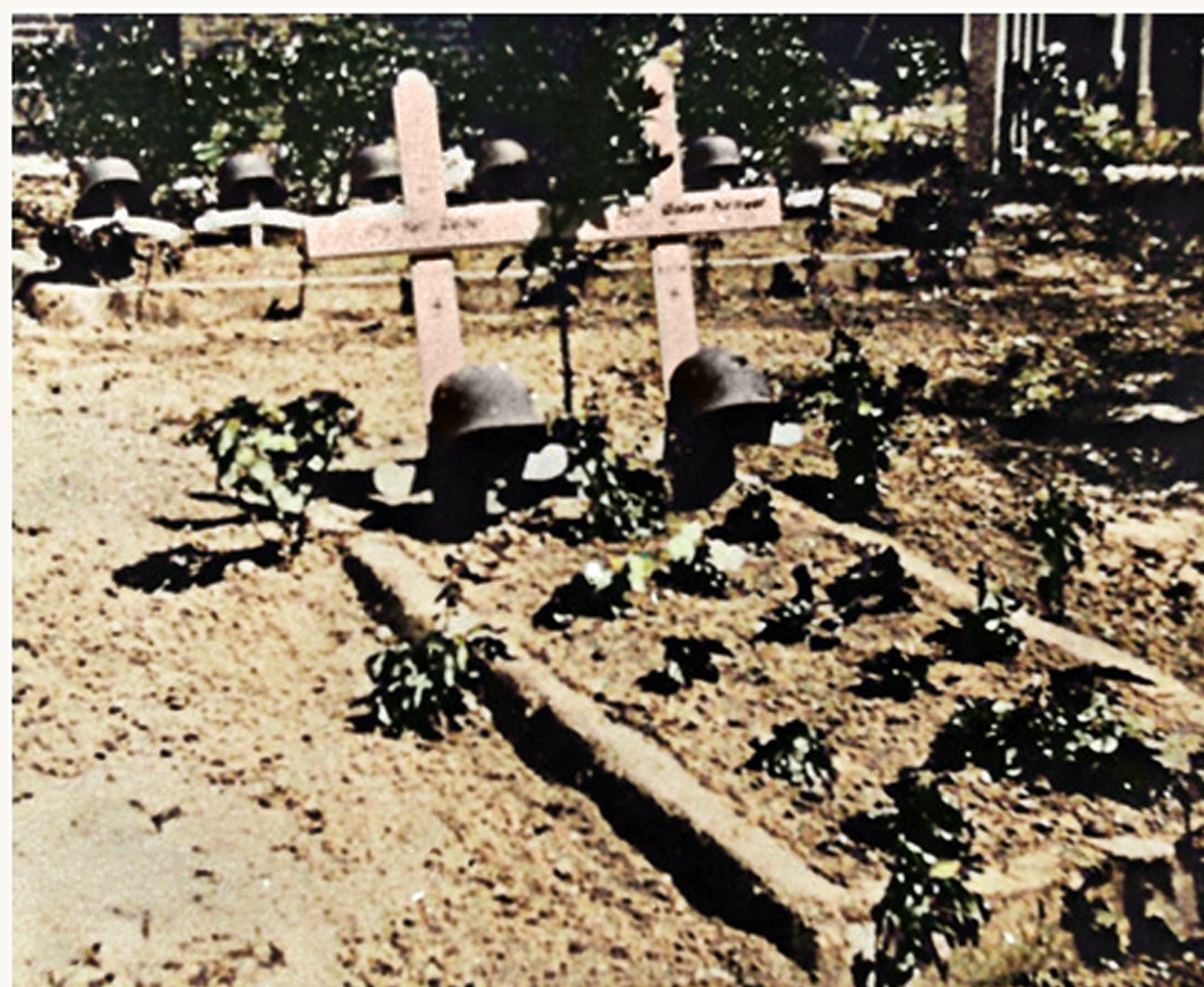
TRICOT Adolphe (°Houdeng-Aimeries 27 april 1919)

Ook aan Duitse zijde vielen zeven slachtoffers.