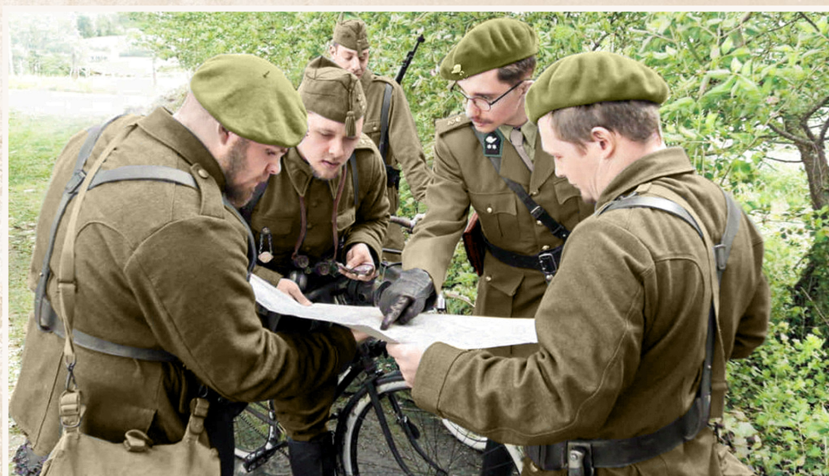
Van 's morgens vroeg wordt Vinkt zwaar gebombardeerd en proberen de Duitsers er door te breken. Maar de Ardense Jagers (foto) kunnen standhouden. De Duitsers lijden zware verliezen. Een nieuwe Duitse divisie wordt ingezet die de vuurdoop nog niet had ondergaan. Burgers worden uit kelders en schuilplaatsen gehaald en opgesloten in de kerk van Meigem (foto re-enactment).