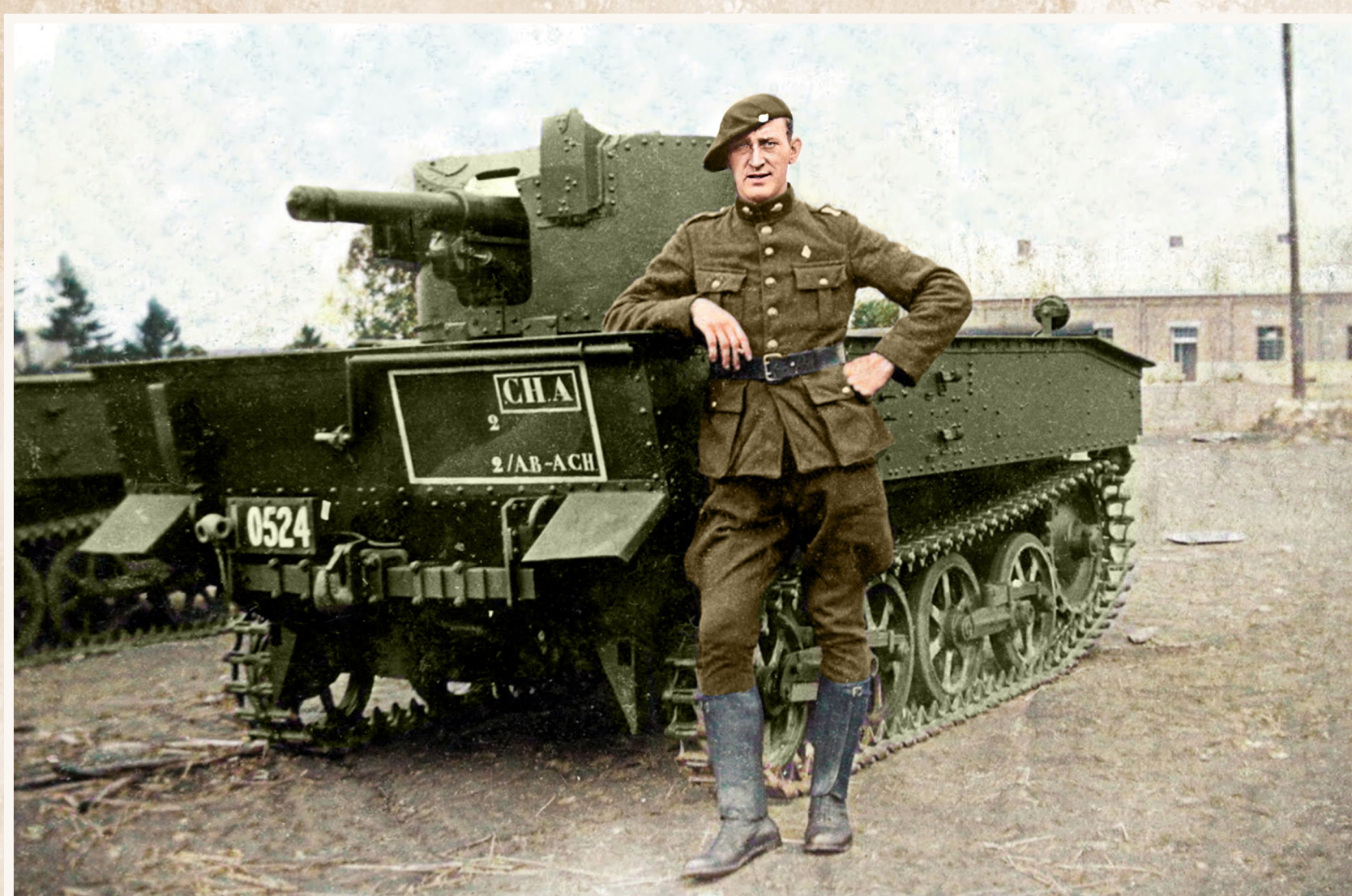
De Duitsers dwingen een groep krijgsgevangenen voorop te lopen als levend schild in de richting van Vinkt. In een poging de Duitsers tegen te houden, beginnen de Ardense Jagers met een tank en geweervuur op de groep te schieten. Dertien Belgische soldaten verliezen hierbij het leven. De Duitsers pogen Vinkt te bereiken maar worden telkens teruggeslagen door de Ardense Jagers, van wie er die dag twaalf sneuvelen.